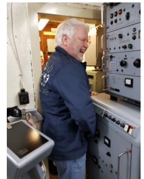
Die gesamte Technik wurde funktionsfähig im Museum installiert und das auf engstem Raum, wie man sieht