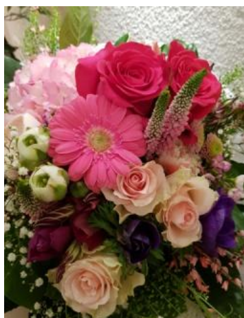
Der digitale „Klub Woterkant“ Geburtstagsblumenstrauß für unsere Kameradinnen und Kameraden!

Wir gratulieren all unseren Kameradinnen und Kameraden zu ihrem Geburtstag und wünschen für die weiteren Jahre alles Gute, ganz viel Glück, Zufriedenheit und natürlich die beste Gesundheit!