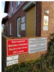
Das ehemalige Luftschutzwarnamt im Museum eingerichtet

Im Obergeschoss erklärte uns Herr Lipski den Zweck des Museums für zivile Verteidigung, das vor mehr als 10 Jahren gegründet wurde. Es sollen ehemalige Einrichtungen des bundeseigenen Luftschutzwarndienstes bewahrt werden, die Erinnerung an die Zeit des „Kalten Krieges“ erhalten und der Öffentlichkeit eine Dokumentationsstätte sein. Mit 2 Filmvorführungen aus dem Filmarchiv, das mit 600 Filmtiteln zum „Kalten Krieg“ bestückt ist, wurden