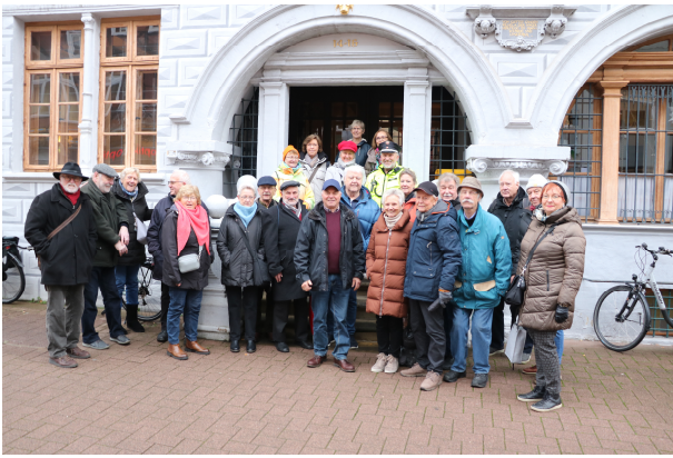
Die Reisetilnehmer des Klub Woterkant vor dem „Ratskeller“

fahren konnten. In Hamburg kamen wir pünktlich um 19.29 Uhr an.