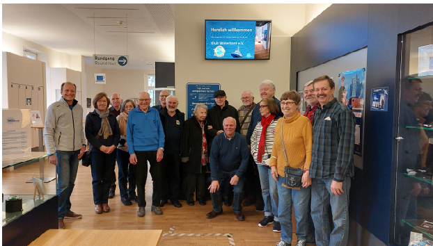
Die Museumsbesucher des Klub Woterkant e.V.

Kameradinnen und Kameraden des Klub Woterkant besuchten am 24.01.2023 das Polizeimuseum in Hamburg. Wir wurden sehr herzlich empfangen und nach einem Gruppenbild führte Holger, der ehrenamtlich im Museum arbeitet, durch einzelne Ausstellungsräume.